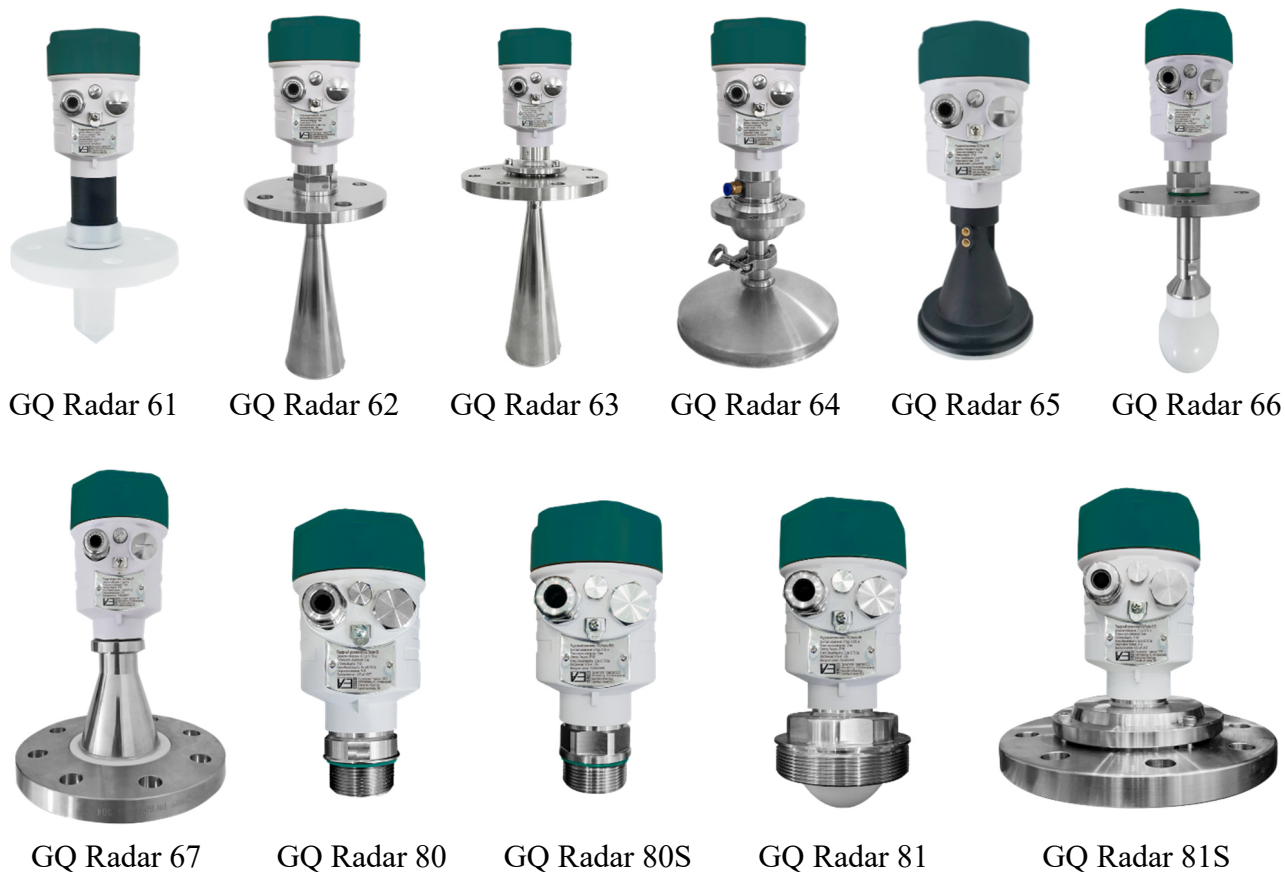
Рисунок 1 – Общий вид уровнемеров